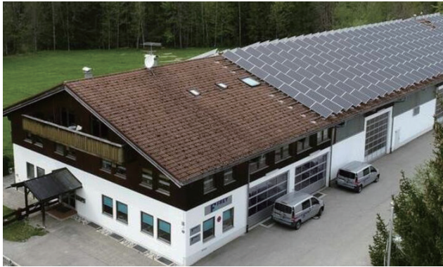
位于德国南部巴伐利亚州伦格里斯富莱克的 Frey and Co. 工厂

Frey and Co. 公司寻求现代化和更高效的技术，来替代他们在 EasyISO 2000 - 4000 KN 陶瓷等静压机中一直沿用的液压系统方案。穆格与Frey合作开发了一款新型现代化电动伺服泵控系统 (EAS)，它包含一个带有集成式电动伺服泵控单元 (EPU) 的功能模块。电动伺服泵控单元是一种节能型解决方案，能够根据选择的基础设施进行非常灵活的设计。