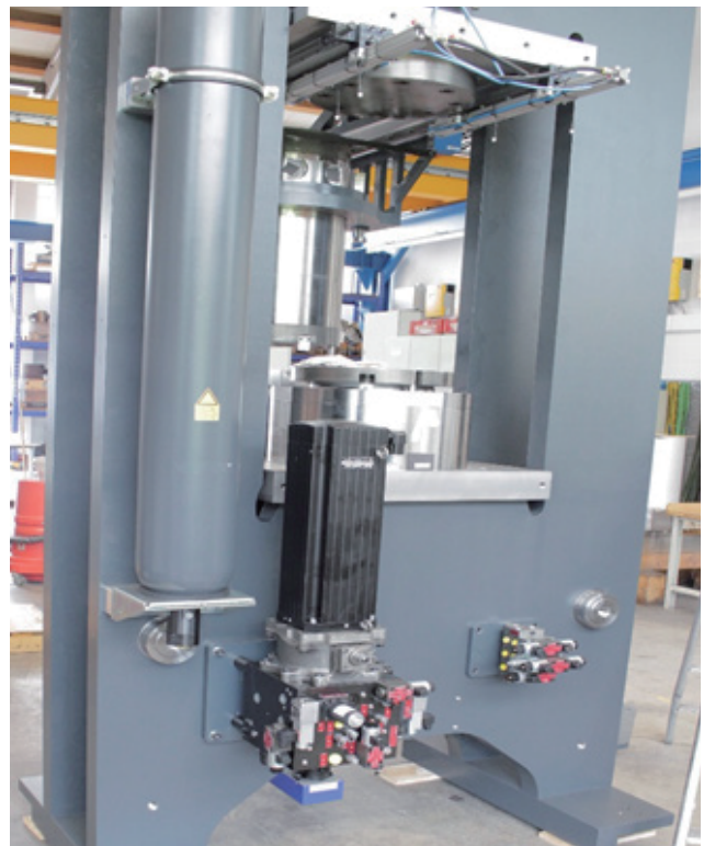
采用穆格电动伺服泵控系统的 Frey EasyISO 陶瓷压机

EasyISO 2,000 和 4,000 KN 压机原来的设计包含一套由穆格的一家主要竞争对手提供，Frey 已经使用多年的传统液压系统方案，用于 5 根独立的机器轴。这套复杂的运动控制解决方案并不理想，因为它需要大量的维护工作，而且能耗也高。这不仅增加了运行成本，也给企业总体生产率带来了挑战。Frey 为了使其压机产品注入新型并更智能和更简单的运动控制技术，他们与穆格接洽，目的是为其等静压机系列引入更先进和更高效的驱动技术。